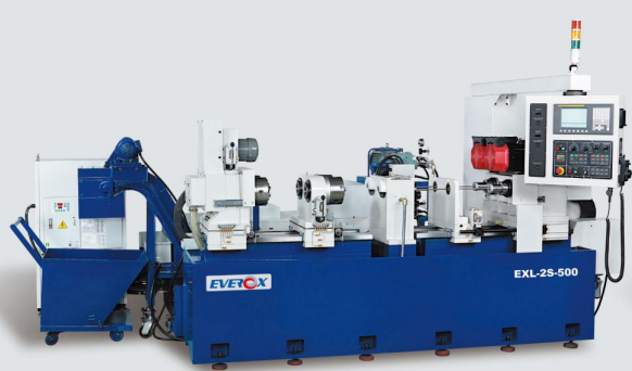
EXL-2S-500 Boring Capacity 鑽孔能力: Ø3~25 mm Length of Processing 最大深度: 500 mm Number of Axis 主軸軸數: 2 axis