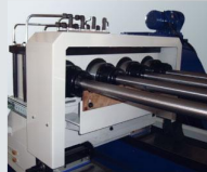
工件油壓夾持 (選配) Hydraulic clamping fixtures (Opt.)