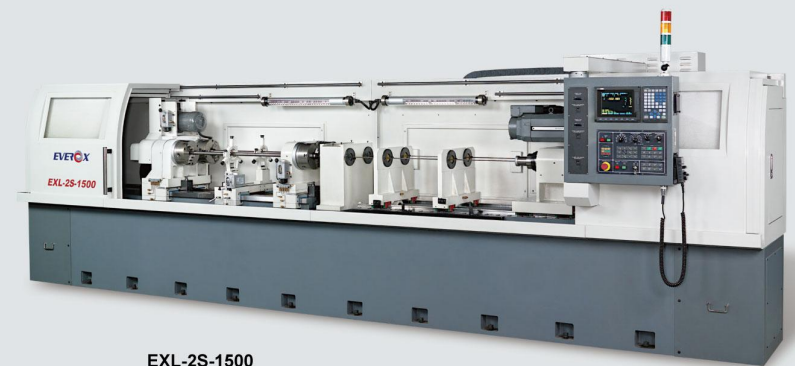
EXL-2S-1500 Boring Capacity 鑽孔能力: Ø3~25 mm Length of Processing 最大深度: 1500 mm Number of Axis 主軸軸數: 2 axis