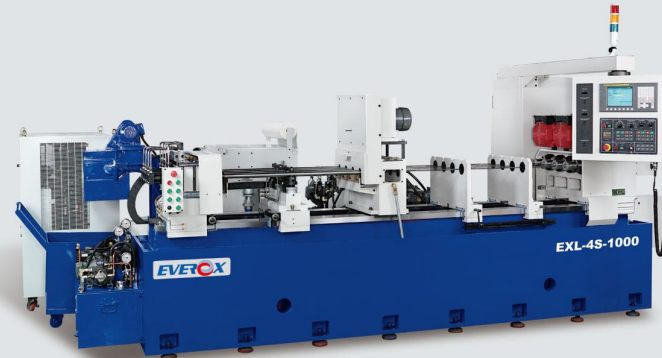
EXL-4S-1000 Length of Processing 最大深度: 1000 mm Number of Axis 主軸軸數: 4 axis