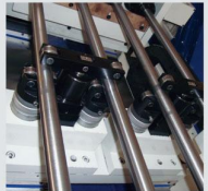
微調工件支撐座組 (選配) Fine-tune the workpiece support Seat (Opt.)