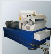
油箱+紙帶過濾機 Paper filter unit