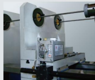
扶刀座: 2軸 / 4軸 Vibration damper: 2-axis / 4-axis