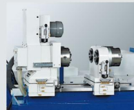
工件夾頭夾持 Boring head clamping fixtures