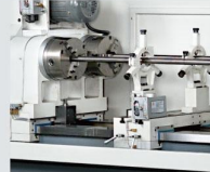
工件支撐中心架 Steady rest