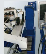
排屑機 Chain type chip conveyor with cart

我們秉持著先進的技術理念，提升生產技術，創造高附加價值、高品質的精密機械，期能提供業界市場的需求。 Our strong R & D capabilities apply leading technology to our machines. Conducting various innovative machines to the market worldwide is our pride.