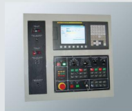
CNC電腦操作面板 CNC controller