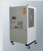
切削油冷卻機 Coolant cooler